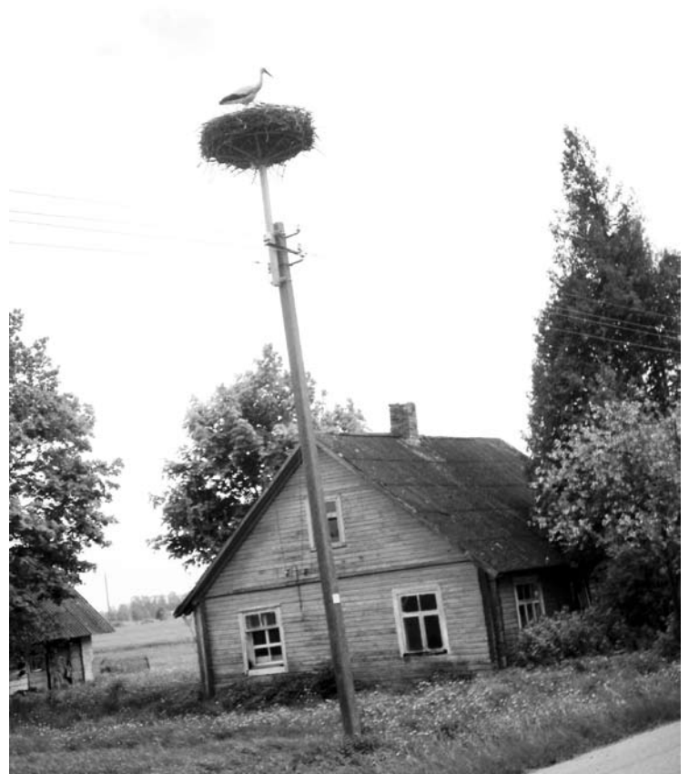
Į kaimą pasitinka ir iš jo išlydi gandrai.