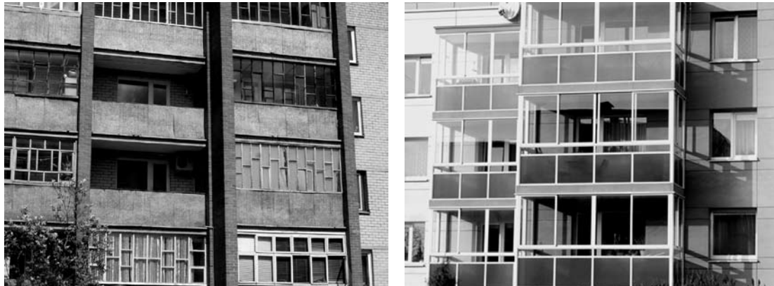
Taip Anykščiuose atrodo seno daugiabučio ir atnaujinto namo balkonai.